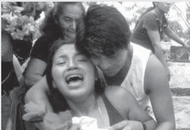
Material utilizado por cortesía de Amnistía Internacional www.amnistia.org

Asimismo, se encuentra información sobre los efectos de las guerras y conflictos en la vida de las mujeres y niñas en: < http://web.amnesty.org/actforwomen/conflict-index-es/ >